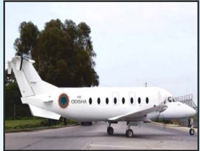
रिजनल कनेक्टिविटी योजना अंतर्गत जगदलपुर एयरपोर्ट में पहली उड़ान