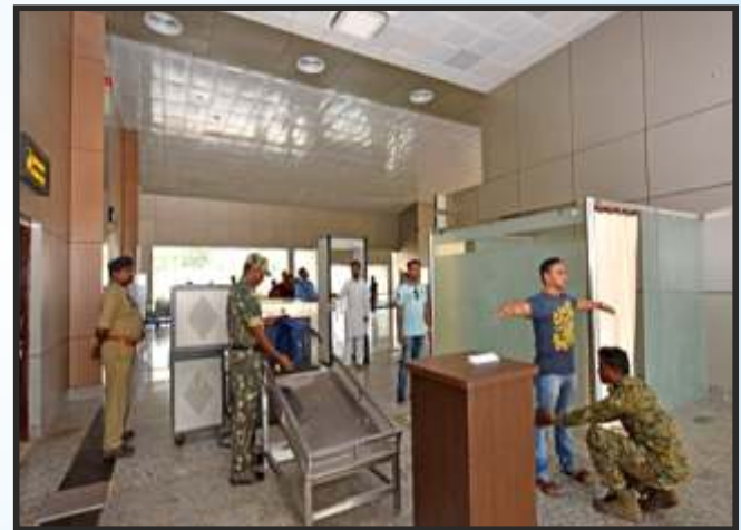
जगदलपुर एयरपोर्ट सुरक्षा चेकिंग क्षेत्र