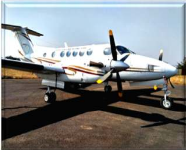
शासकीय विमान B-200

वर्ष 2007 में शासकीय हेलीकॉप्टर ऑगस्ता ए 109 पावर, व्ही.टी.-सी.एच.जी , इटली की कम्पनी ऑगस्ता वेस्टलैंड से राशि ₹ 25.96 करोड़ में क्रय किया गया है। यह दिसंबर 2007 से उड़ान हेतु उपलब्ध है। इस हेलीकॉप्टर की बैठक क्षमता 2+5 है। हेलीकॉप्टर द्वारा 01 जनवरी, 2018 से 31 दिसम्बर, 2018 तक 203:45 घंटे एवं कुल 2730:06 घंटे की उड़ान सफलतापूर्वक पूरी की गई है। अतिविशिष्ट व्यक्तियों की यात्राओं व शासकीय कार्यों में इसका उपयोग किया जा रहा है। हेलीकॉप्टर का परिचालन शासन द्वारा नियुक्त पायलटों द्वारा एवं संधारण का कार्य विभागीय अभियंताओं द्वारा रायपुर पुलिस लाईन स्थित शासकीय हँगर में किया जा रहा है।