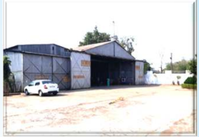
स्टेट हैंगर, (हेलीकॉप्टर) पुलिस लाईन रायपुर