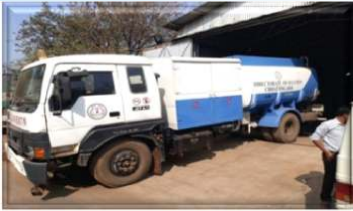
शासकीय ATF फ्यूल बाऊज़र

नक्सली समस्या के निदान हेतु एयरफोर्स व BSF के उड़ान एवं राज्य पुलिस के संयुक्त मूवमेंट में प्रयुक्त हेलीकॉप्टरों के लिए फ्यूल उपलब्ध कराने हेतु विभाग द्वारा 07 नग फ्यूल बाऊज़र एवं 01 नग आयल टैंकर क्रय किया जाकर कांकेर, नारायणपुर, सुकमा, दन्तेवाड़ा, जगदलपुर, बीजापुर व अम्बिकापुर में बाऊज़र स्थापित किये गये हैं तथा बाऊज़र संचालन व रख-रखाव हेतु पुलिस विभाग के कर्मचारियों को प्रशिक्षण भी प्रदान किया गया है। इसके अतिरिक्त राज्य शासन के उपयोग हेतु 02 नग फ्यूल बाऊज़र क्रय कर रायपुर में रखा गया है। जिससे हवाई उड़ान हेतु दूरस्थ स्थानों में फ्यूल उपलब्धता आसान हो गई है। विभाग द्वारा IOCL तथा BPCL से ATF क्रय किया जाता है।