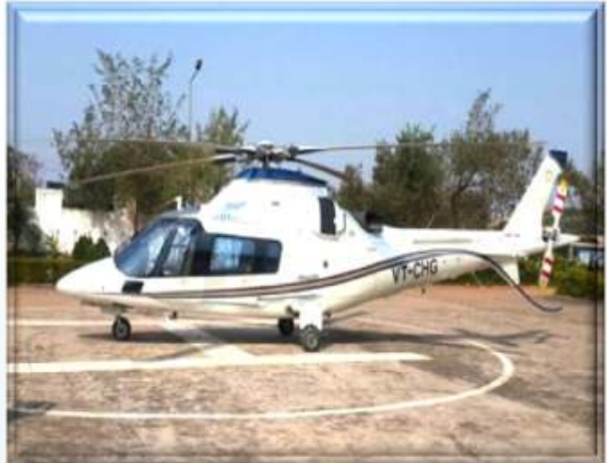
शासकीय हेलीकॉप्टर A-109