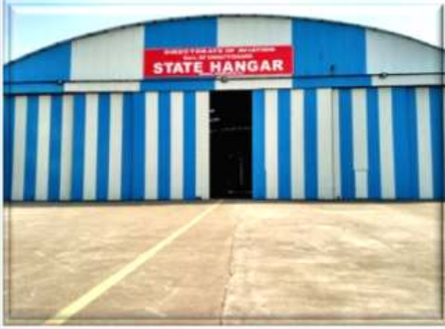
स्टेट हैंगर, (विमान) माना, रायपुर

स्टेट हैंगर सह प्रशासकीय भवन को स्वामी विवेकानंद एयरपोर्ट, माना, रायपुर के निर्माणाधीन नवीन बाउंड्रीवाल के भीतर लाया जा रहा है। जिससे हैंगर को ब्यूरो ऑफ सिविल एविएशन सिक्योरिटी द्वारा निर्धारित एयरपोर्ट सुरक्षा मानकों की प्राप्ति होने पर यहां से उड़ान संचालन प्रारम्भ हो सकेगा।