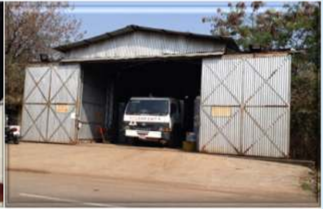
पुलिस लाईन, रायपुर स्थित बाऊज़र शेड