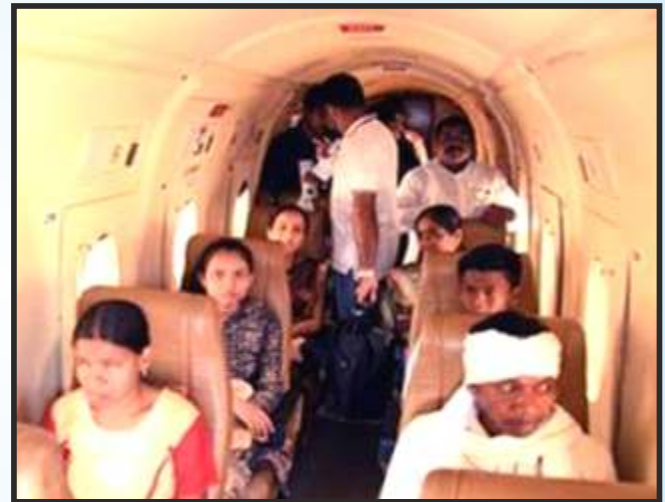
जलदलपुर-रायपुर उड़ान के यात्रीगण