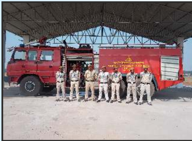
अम्बिकापुर एयरपोर्ट में अग्निशमन दल

एयर ओडिशा द्वारा जगदलपुर एयरपोर्ट से संचालित घरेलु उड़ान की संख्या तथा यात्रियों की जानकारी