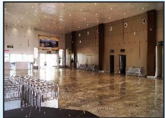
जगदलपुर एयरपोर्ट टर्मिनल हॉल