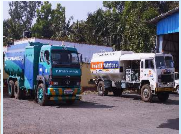
जगदलपुर स्टेट हैंगर , बाऊज़र शेड तथा बाऊज़र