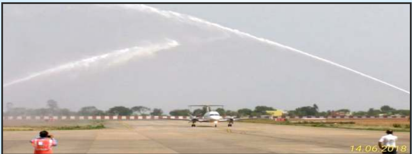
रिजनल कनेक्टिविटी योजना की पहली उड़ान का रायपुर एयरपोर्ट में वाटर जेट से स्वागत