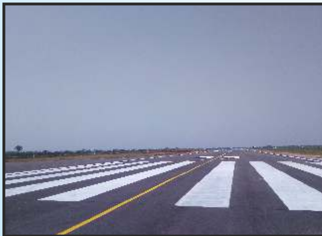
बिलासपुर एयरपोर्ट रनवे